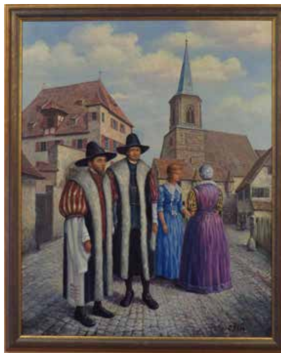
Maler: W. Kuboth